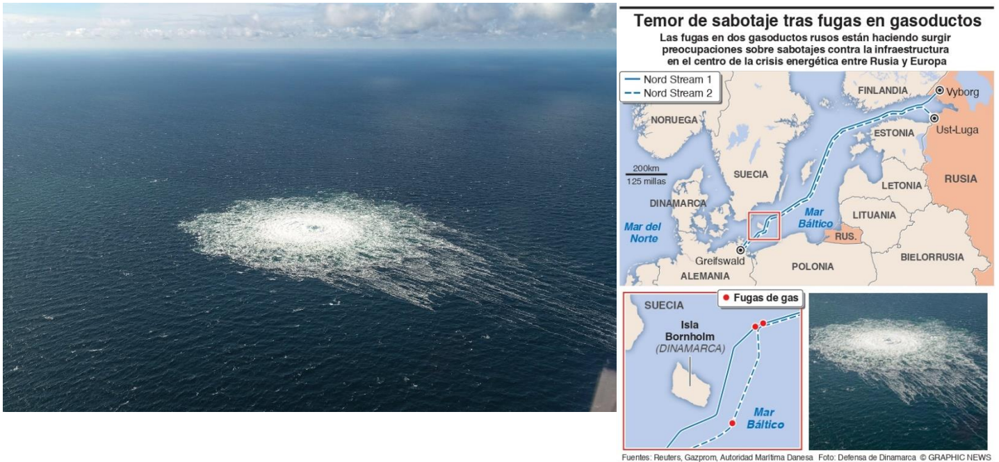
Imagen de la mancha de burbujas en el mar báltico captada por la cámara de un F16 danés.

Europa continúa siendo afectada por la crisis derivada de la guerra entre Rusia y Ucrania, tras dos fugas en el gasoducto Nord Stream 1 (línea que dejó de transportar gas desde este mes, como represalia por las sanciones económicas a Rusia) y dos en la línea Nord Stream que nunca entro en funcionamiento pero que contenía gas a presión.