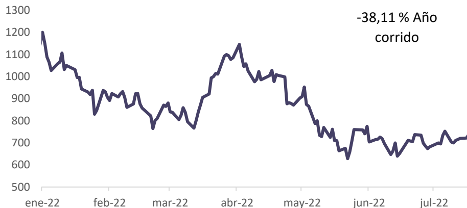
Gráfico 2. Precio de la acción de TESLA

El mercado tomó positivo los resultados y la acción se recupera con bastante volumen de negociación (Gráfico 2) Inversionistas estarán atentos a la reunión anual con inversionistas para ver la estrategia y visión de largo plazo de la compañía , la reunión se llevará acabo el 4 de agosto, 2022 Annual Meeting of Stockholders